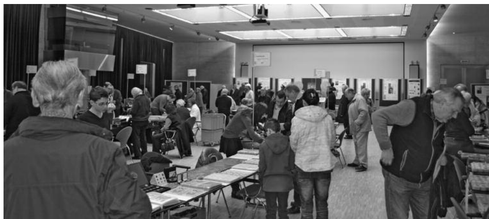
Salle Schiele, salon numismatique 2014