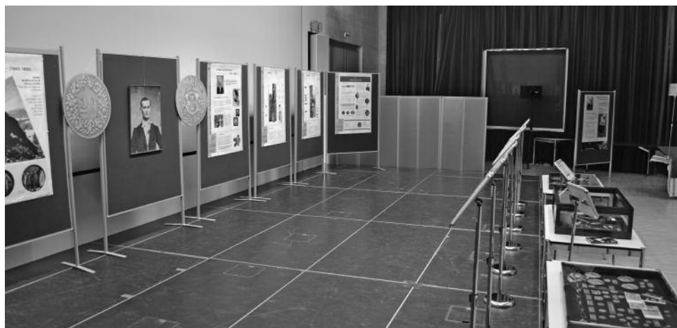
Vue partielle de l'exposition didactique « Fausse monnaie »

Grâce à la collaboration des « Amis de Farinet », du musée de la fausse monnaie à Saillon, de la banque nationale suisse à Berne ainsi que de l'association « Atelier Ciel & Terre », une exposition riche en informations, anecdotes et objets sur le thème de la fausse monnaie a pu être présentée. Elle a suscité un vif intérêt auprès des visiteurs autant que des exposants et com-